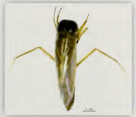
Fig. 4.- Habitus de Anisops debilis canariensis Noualh. (♂)

Este taxón coloniza las aguas estancadas permanentes o temporales, de modo similar a como ocurre con el taxón anteriormente estudiado, Anisops debilis canariensis N.